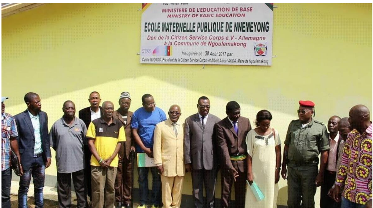
Photo de groupe des officiels lors de la cérémonie

L'ONG de la Diaspora Camerounaise de droit Allemand, Citizen Service Corps e.V. (CSC e.V.) offre une salle de classe à l'école maternelle de Nnemeyong par Ngoulémakong comme don.